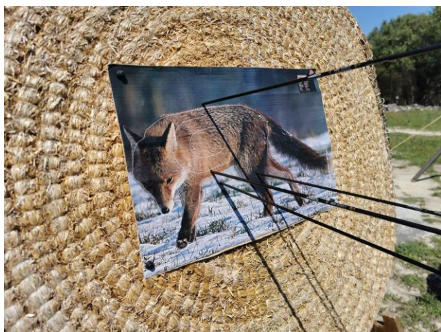
Le Club d'Ollioule

Vous trouverez toutes les modalités sur le site du Comité Régional.